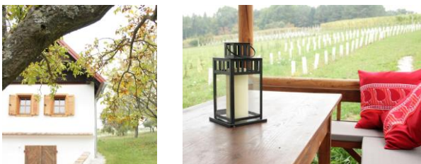
Das Kellerstöckl in der Bergstraße 77 liegt inmitten der Weinberge. Die Idylle und Ruhe bietet einen energiereichen Platz, um kreative Schreivarbeiten zu erledigen oder einfach nur die Natur zu genießen.

Das Domizil am Zellenberg eignet sich aber auch aus beruflicher Sicht zum Jahresende als Rückzugsort für teaminterne Klausuren, um das Unternehmen weiter zu entwickeln, einen Blick zurück zu werfen um es anschließend strategisch für die Zukunft auszurichten.