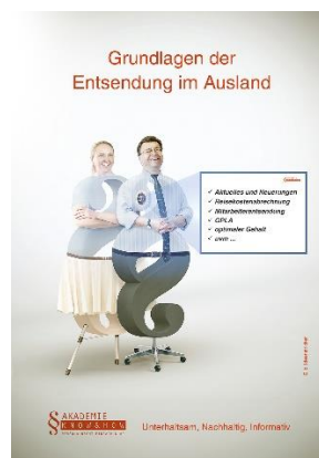
Keyvisual „Steuer und Service“