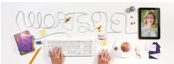
Collage für Textagentur „Wortspiel“